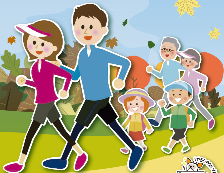
東京都がん検診啓発キャラクター 「モシカモくん」