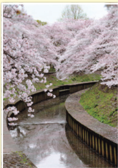
川のフォトコンテスト応募作品