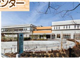
みどころ10 稲田公園

平成23年3月に開館した、屋内の温水プールやアーチェリー練習場などを備えたスポーツ施設です。施設提供のほか、各種スポーツ教室などを行っています。