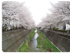
みどころ3 穴澤天神社

多摩川の支流で、鯉が泳ぎ、時にはカワセミを見ることもできます。春には川沿いの約320本の桜が咲き、市内外から写真を撮りに集まり、川沿いは賑わいをみせます。