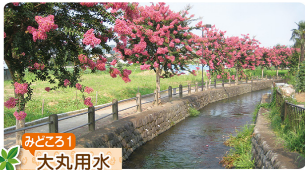
みどころ1 大丸用水

稲城市大丸の多摩川から取水し、川崎市登戸まで流れる用水で、江戸時代以降、農業用水として維持・管理されてきました。現在は農業用水としての機能は失われつつありますが、親水公園として整備され、夏にはサルスベリ、秋には紅葉が美しく、重要な水辺として人々に親しまれています。