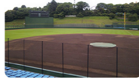
みどころ7 東京ヴェルディグラウンド

京王よみうりランド駅から、読売ジャイアンツ球場へ向う「よみうりV通り」には2009年当時、日本一となった巨人選手、監督、コーチの手形があり、応援に来た人を歓迎します。