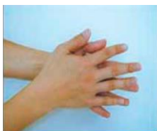
①手のひらをよくこする