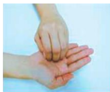
③指先・爪の間を念入りにこする