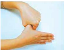
⑤親指と手のひらをねじり洗い