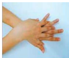
②手の甲をよくこする