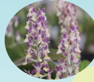
神津島村の花 コウヅエビネラン

白い砂浜と入り江、緑豊かな山と変化にとんだ島です。その昔、伊豆の島々を作るために神々が集まって相談をしたという伝説から神津島という名前がつけられたと言われています。