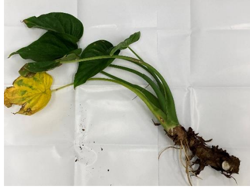
シマクワズイモ全体像