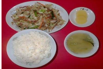
肉野菜炒めライス 900円（税込）

定休日： 火曜日 営業時間： 11:30~13:00 17:00~19:00 TEL： 04996-2-0088