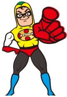
ケンコウデスカマン

野菜には、生活習慣病やがんの予防に欠かせないビタミン、ミネラル、食物繊維などが多く含まれており、1日に摂りたい量は350g以上(成人)です。しかし、都民の約6割は目標に達していないことから、東京都では、野菜をたくさん食べられるメニューを提供する「野菜メニュー店」の募集をしています。