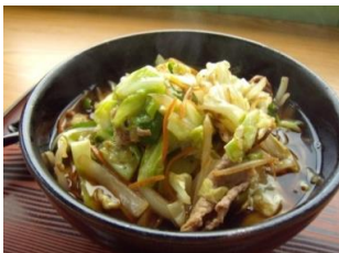
肉野菜炒めそば 1000円（税込）

定休日： 月曜日 営業時間： 11:00~14:00 17:00~19:00 TEL： 04996-7-0040