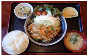
生姜焼定食 980円（税込）

定休日： 火曜日 営業時間： 7:00~ 9:30 11:00~14:00 17:00~24:00 TEL： 04996-2-1002