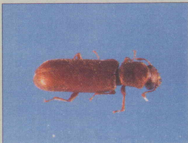
●ヒラタキクイムシ成虫(体長約3~6mm)