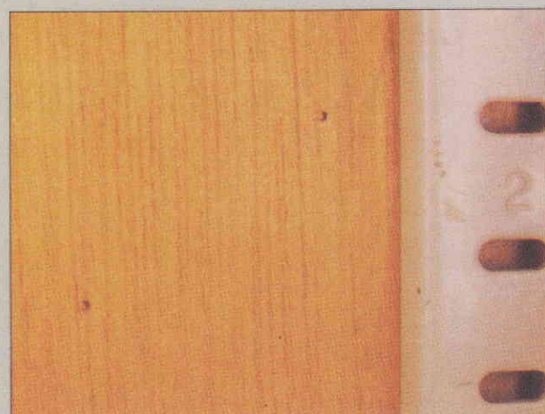
●ラワン材の脱出孔

ラワン材などの表面に粉がこぼれ、小さな穴があくことがあります。これはヒラタキクイムシなどの仕業です。