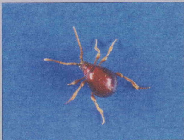
●ニセセマルヒョウホンムシ成虫 (体長2~3mm)