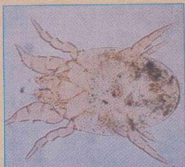
コナヒョウヒダニ 体長0.3~0.4mm 乳白色