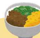
三食丼 (主食・主菜・副菜)