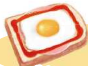
ハムエッグトースト (主食・主菜)

忙しい朝に何品も作るのは大変！という方には、ワンプレート（複合料理）や汁物がおススメ。準備や片付けの負担軽減につながります。