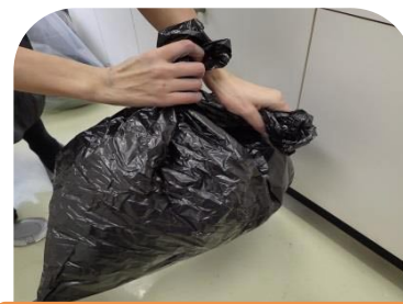
汚れたものに触った後