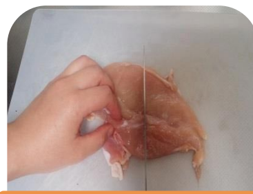
生ものに触った後