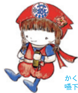
かくれ 嚥下ちゃん