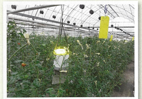
▲黄色蛍光灯による害虫防除