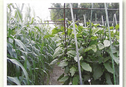
▲バンカープランツによる農薬削減