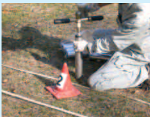
【ダイオキシン類土壌環境調査】 (試料採取状況)

環境中や農畜産物、魚介類などに含まれる微量化学物質の調査を行い、環境からの食品の汚染実態を把握しています。