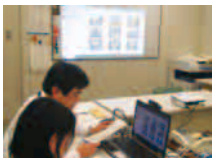
【WEB会議を活用した訓練】