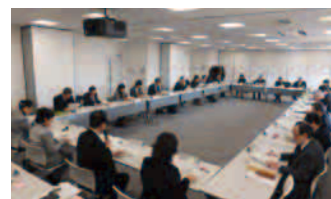
【食品安全情報評価委員会】