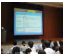
【食品表示の事例検討】 (適正表示推進者育成講習会)