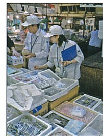
卸売市場における監視指導

卸売市場など食品の製造・流通の拠点となる施設や、地域の営業施設の監視指導を行い、都内に流通する食品の安全確保に取り組んでいます。