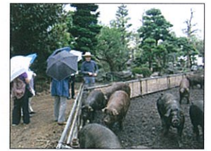
東京都消費者月間事業「見て食べて学んで 農業交流ツアーin 東京」