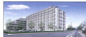
(健康危機管理センター(仮称)の完成予想図)