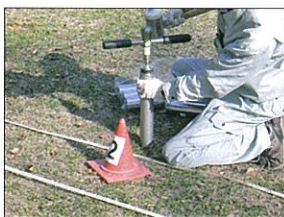
ダイオキシン類土壌環境調査 (試料採取状況)

環境中や農畜産物、魚介類などに含まれる微量化学物質の調査を行い、環境からの食品の汚染実態を把握しています。