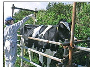
家畜保健衛生所職員による牛のダニ駆除