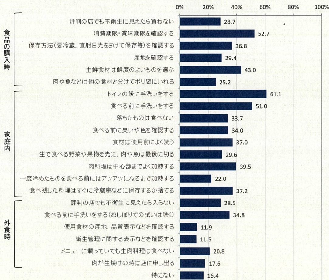
図 4-4 食中毒予防の取組・心掛け (N=3,000)