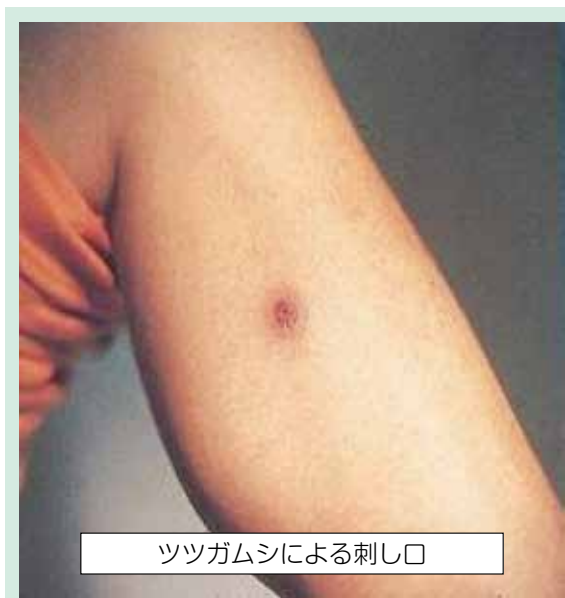
ツツガムシによる刺し口