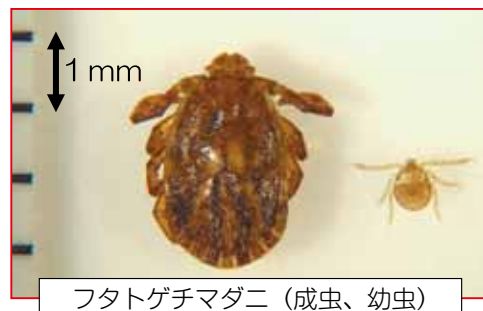
フタトゲチマダニ（成虫、幼虫）

西多摩地域では、これまでSFTSの報告はありませんが、マダニは広い範囲で生息しています。十分に注意しましょう。