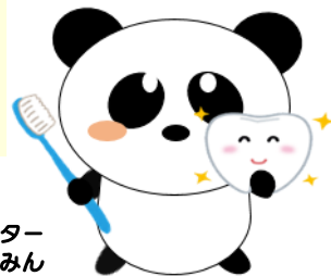
南多摩保健所健康づくりキャラクター みなみん

・LGWAN 接続のパソコンからお申込みいただく場合は、保健所ホームページをご活用ください。