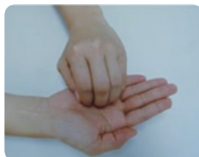
③指先・爪の間も洗う