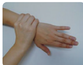
⑥手首を回すように洗う