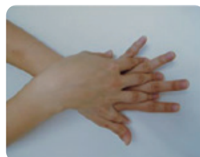
②手の甲をのぼしこする