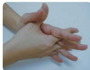
④指の間もよく洗う