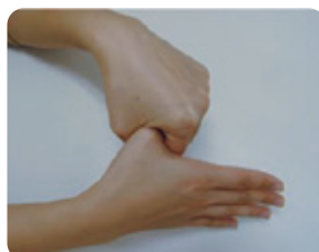
⑤親指つけねからねじり洗い