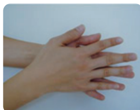
①手のひらをよくこする