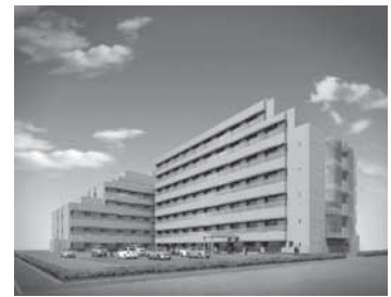
<再編整備後のセンター（イメージ）>