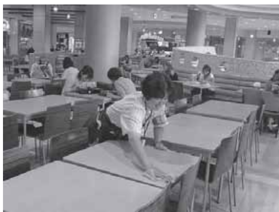
<障害者職場実習ステップアップ事業・企業実習の様子>