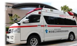
病院救急車（多摩南）