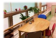
がん相談スペース