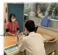
入院サポートの様子