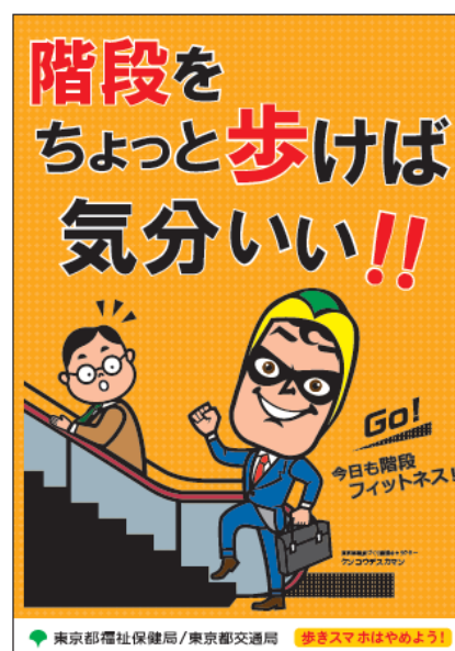
【階段下・業務枠掲出ポスター（案）】