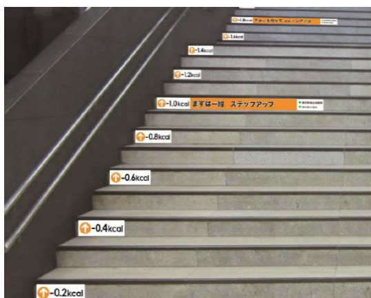
【階段ステップ広告イメージ（案）】