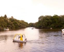
武蔵野市 井の頭恩賜公園