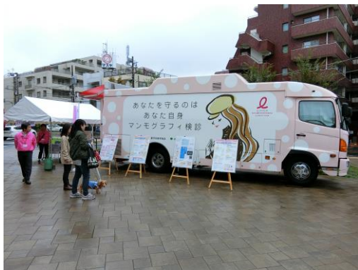
マンモグラフィ検診車

会場内に乳がん検診普及啓発用にラッピングした検診車を設置し、車内の見学や乳がん検診の説明、視触診モデルの体験を実施しました。※協力：公益財団法人東京都予防医学協会