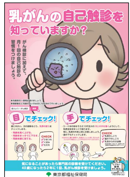
自己触診法啓発ポスター