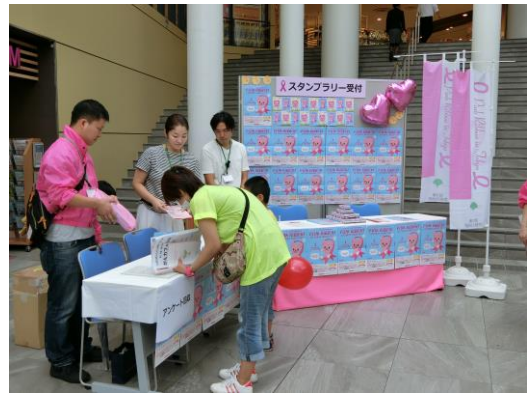
スタンプラリー受付