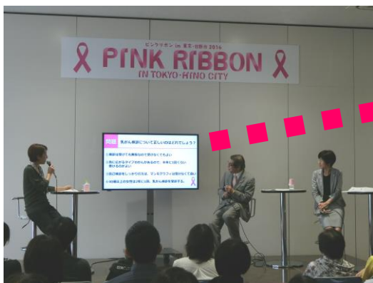
乳がん検診に関するクイズ