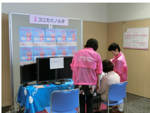
企業によるブース