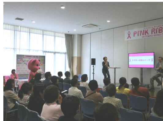
トークショーの様子