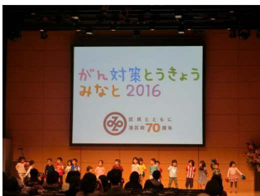
講演の間に行われた子どもたちによる演奏やダンス発表