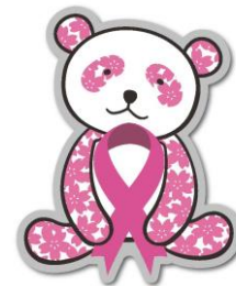
さくらパンダピンバッジ