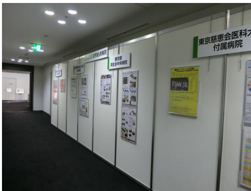
医療機関による展示