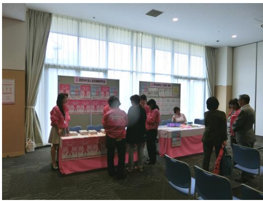
NPO 団体・がん患者の会 ブース