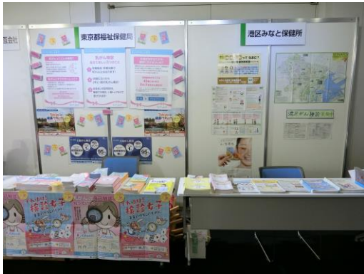
東京都・港区ブース