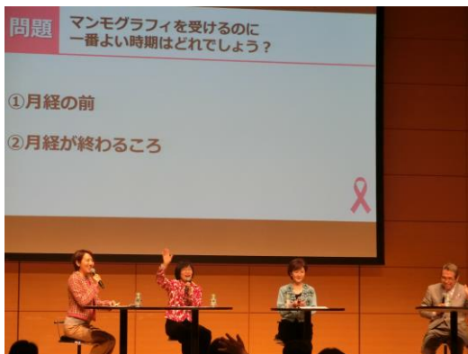
トークショーの様子

その他ステージでは、生稲さんの講演や、専門医によるがん予防や治療についての講演会、港区内の園児・児童による歌や鼓笛演奏等の発表も行われました。