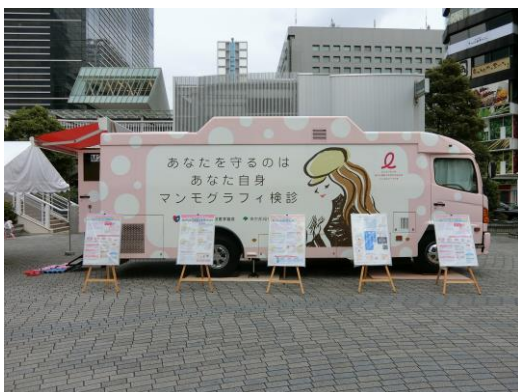
マンモグラフィ検診車