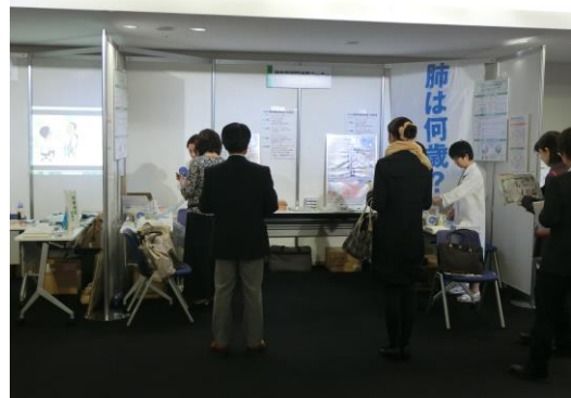
肺年齢測定ブース