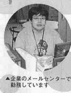
▲企業のメールセンターで勤務しています