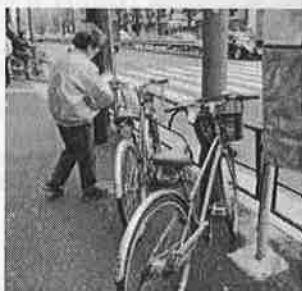
▲皆が歩きやすい歩道をめざしましょう

放置自転車問題は区だけで解決することはできません。そこで、駅周辺の地元商店会や町会など区民の方に「自転車放置防止協力員」として、放置防止のボランティア活動をしていただいています。 現在、約420名の「自転車放置防止協力員」の皆さんが放置自転車をなくすために、注意札のはり付けや放置防止の呼びかけなどに取り組んでいます。 このような区と住民による協働の取り組みによって、現在では、駅前の放置自転車は年々、減少しつつあります。