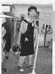
▼スーパーの青果部で品だしをしています

配送センターで品物のチェックをしています。はじめは、ジョブコーチと一緒に仕事を覚えていきます。