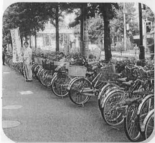
▲買い物客の放置自転車であふれる歩道。通行の妨げになっています。(京王井の頭線高井戸駅前)

放置自転車問題は区だけで解決することはできません。そこで、駅周辺の地元商店会や町会など区民の方に「自転車放置防止協力員」として、放置防止のボランティア活動をしていただいています。 現在、約420名の「自転車放置防止協力員」の皆さんが放置自転車をなくすために、注意札のはり付けや放置防止の呼びかけなどに取り組んでいます。 このような区と住民による協働の取り組みによって、現在では、駅前の放置自転車は年々、減少しつつあります。