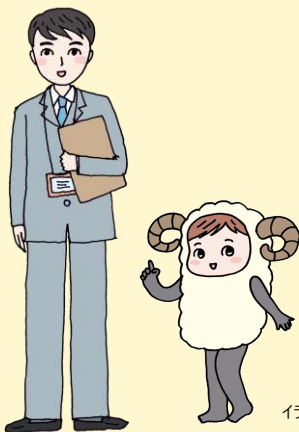
イラスト | 細川 紹々