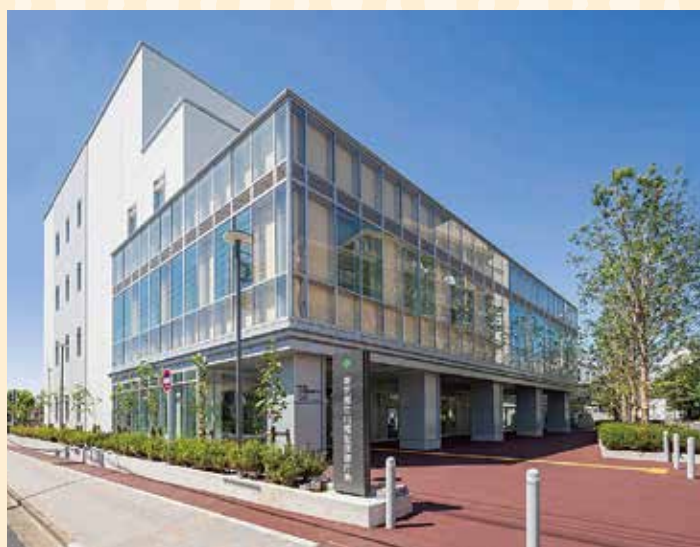
多摩立川保健所新庁舎（東京都立川福祉保健庁舎）