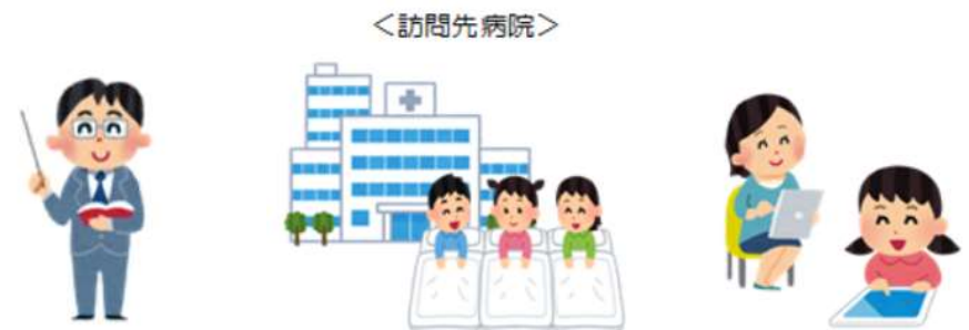
教員による訪問教育