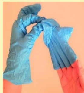
② 手袋を てぶくろ うらがえ 裏返す ように ぬ 脱ぐ