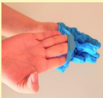
⑤ はずした てぶくろ 手袋を つつ こ 包み込むように てぶくろ うらがえ 手袋を ぬ 裏返して ぬ 脱ぐ