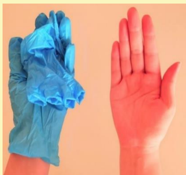
③ ぬ 脱いだ 手袋は てぶくろ はんたいがわ 反対側の て 手に にぎ 握る