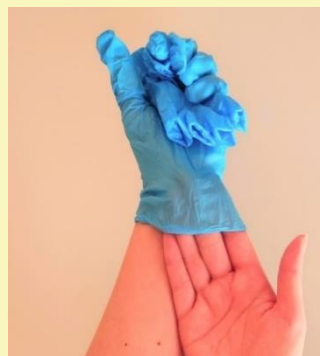
④ 手袋の てぶくろ ひょうめん 表面に ふ 触れないように てくび うちがわ 手首の ゆび 内側から さ 指を さ 差し込む こ