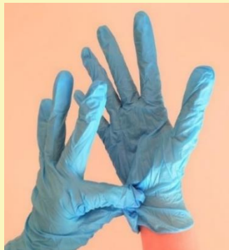
① 手首の てくび 手袋を てぶくろ つまむ