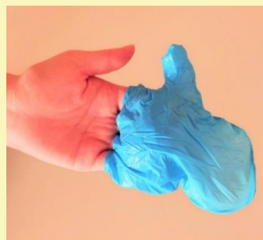
⑥ き 決められた ばしょ 場所に す 捨てる