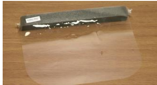
ゴーグルの代わりに フェイスシールド、アイシールドでも可