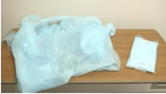
プラスチックガウン