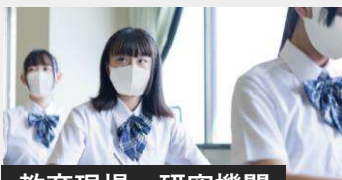
教育現場・研究機関

お客様訪問がある接客クルーやどうしても出社せざるを得ない職場でも、安心して働くことを目指します。