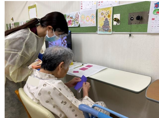
▲ 日中活動として折り紙を楽しむ様子