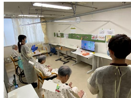
▲ 体操等のリハビリテーションを実施

医師が必要と判断した場合、 病院へ転院 していただくことや、 入所中に 外部の医療機関を受診 していただくことがあります。 ※コロナ治療薬の処方や検査を受けた場合等、別途医療費がかかります。