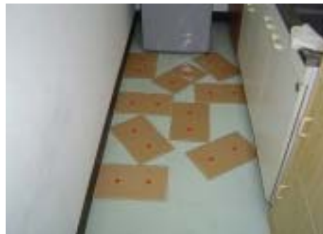
〔写真11 ランダムに並べたところ。〕