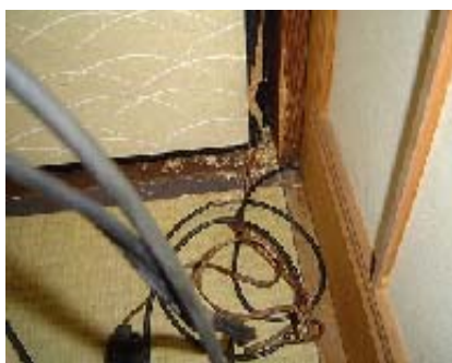
〔写真6 齧られたふすまとケーブル〕