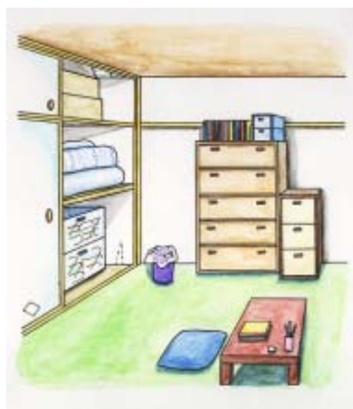
図2 ねずみの出にくい環境

ねずみは巣の材料が手に入りやすく、安全、快適な場所を探して営巣する。乱雑な部屋はねずみが身を隠す場所が多く、また清掃が行き届いていない部屋は、往々にして人間の残飯や食べかすがあり、それを食べにねずみが集まるため、結果的にねずみの温床となる危険性がある（図1）。従って、巣材になる衣類などはねずみに持ち出されないよう収納箱等に収納し、室内を整理・整頓するとともに、不要物を積み重ねて放置せず、すみやかに処分する必要がある（図2）。