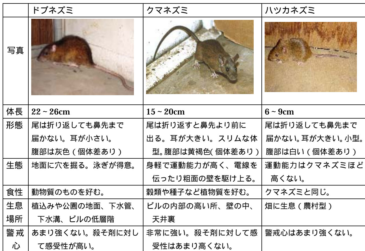
表1 ドブネズミ、クマネズミ、ハツカネズミの比較表

ンション・食品工場では、ハツカネズミが生息しているところもある。それぞれの見分け方を表1に示す。