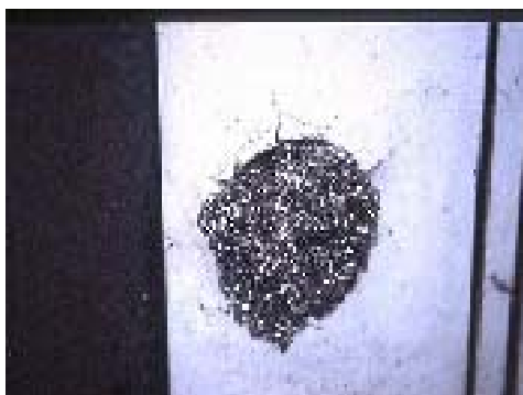
〔写真8 金属タワシによる防ぞ処理〕

穴塞ぎの手順は、最初は内側（居住空間側）から塞いでいき、各部屋ごとに区切り、ねずみの出ない部屋を作っていく。最後まで出る部屋、特によく見る部屋でねずみを追い詰めて粘着トラップ等で捕獲し、最後に外側から塞ぐ。