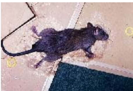
〔写真12 大型のねずみは複数枚で捕獲〕