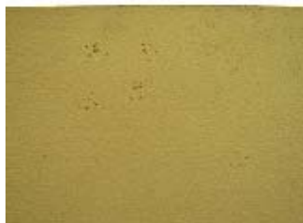
〔写真7 ねずみの足跡〕