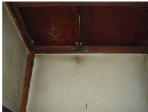
〔写真5 仏壇の上の穴とラットサイン〕