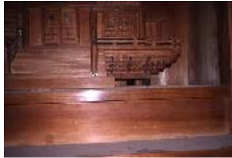
〔写真3 神棚に開けられたねずみの穴〕