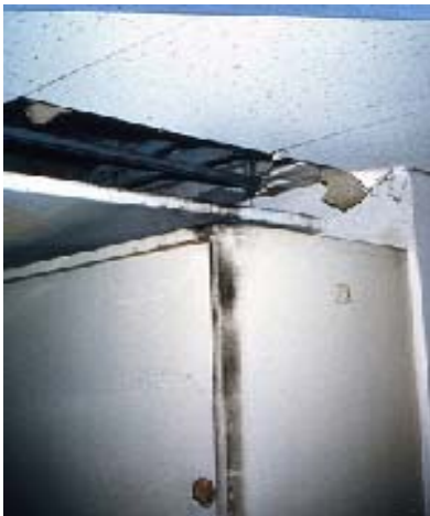
〔写真4 スチール製倉庫のラットサイン〕