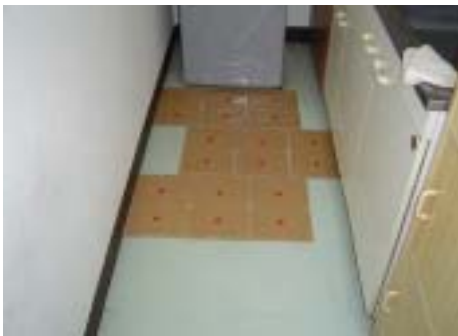
〔写真10 規則正しく並べたところ。〕

効果的な使用法は、下の写真のように、ねずみがよく通る通路全体に複数枚配置することである。その際、並べ方は規則正しく並べる方法（写真10）と、ランダムに並べる方法（写真11）があり、どちらかを選択し、捕獲できなければ逆の方法をとる。また、大型のねずみの場合、トラップの設置が少ないと逃げられることがあるので、捕獲できないときはトラップの配置枚数を増やしてみることも必要である（写真12,13）。