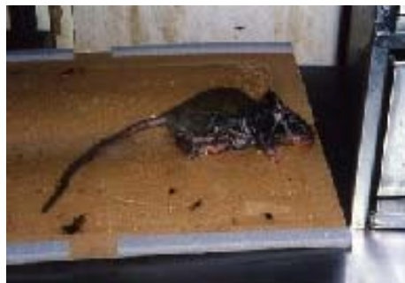
〔写真13 小型のねずみは一枚でも捕獲できる〕