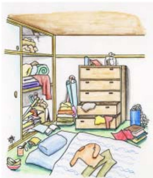
図1 ねずみの出やすい環境