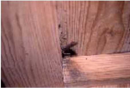
〔写真2 齧られた穴とラットサイン〕