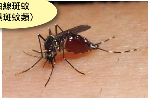
白線斑蚊 (黑斑蚊類)