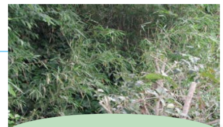
這種地方就是潛藏地點

登革熱與茲卡病毒感染症無有效的疫苗接種。為避免感染，不被蚊子叮咬是很重要的。實行減少白線斑蚊等的對策，並注意不要被蚊子叮咬吧。