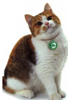
首輪に身元表示を付けた猫