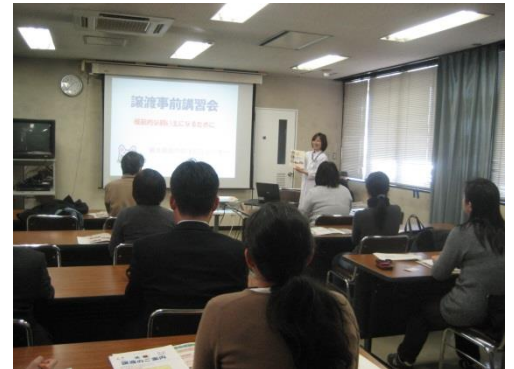
譲渡事前講習会の様子