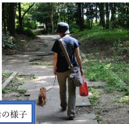
新しい飼い主との生活の様子