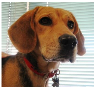
鑑札・注射済票を付けた犬