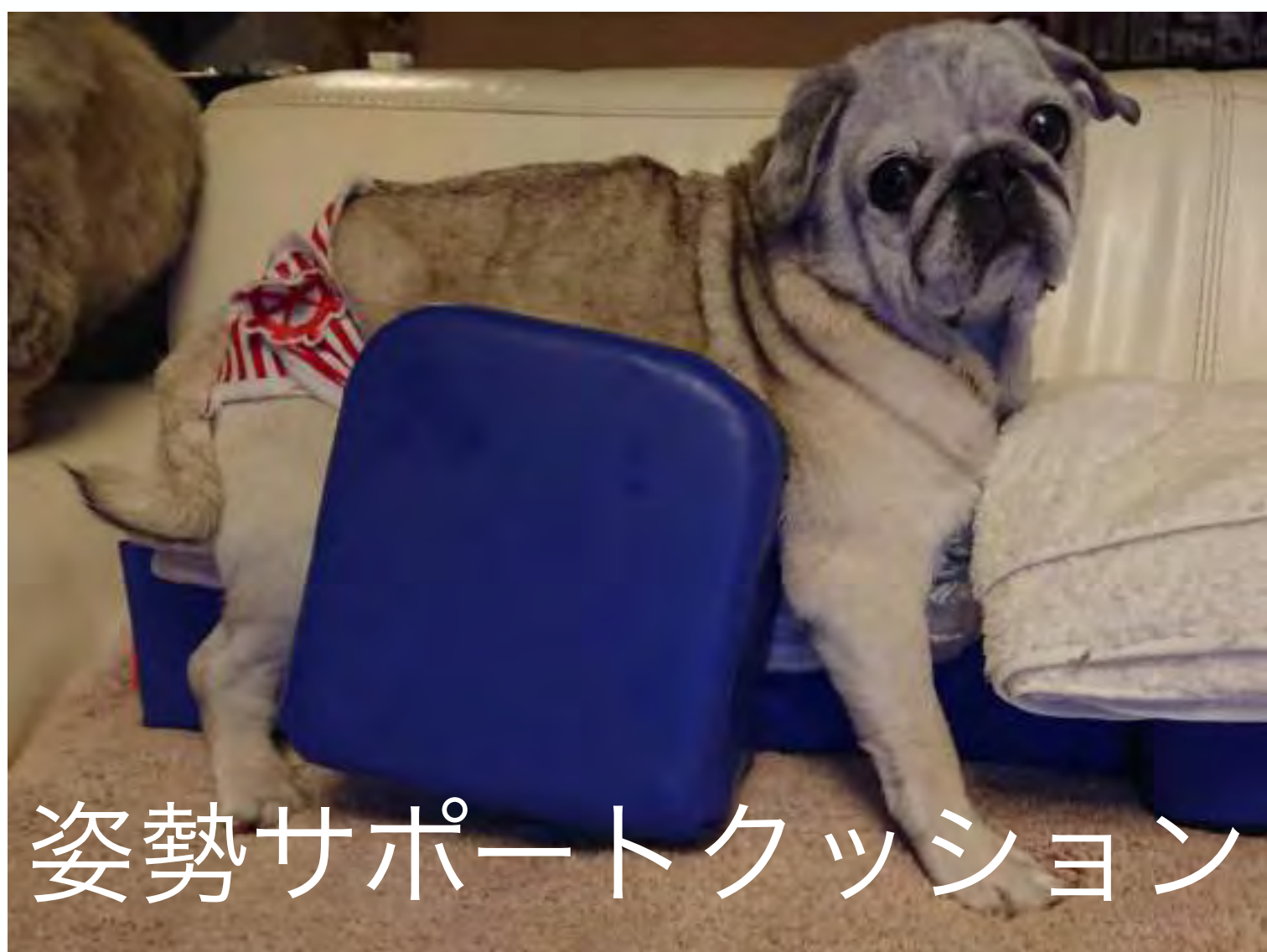
姿勢サポートクッション