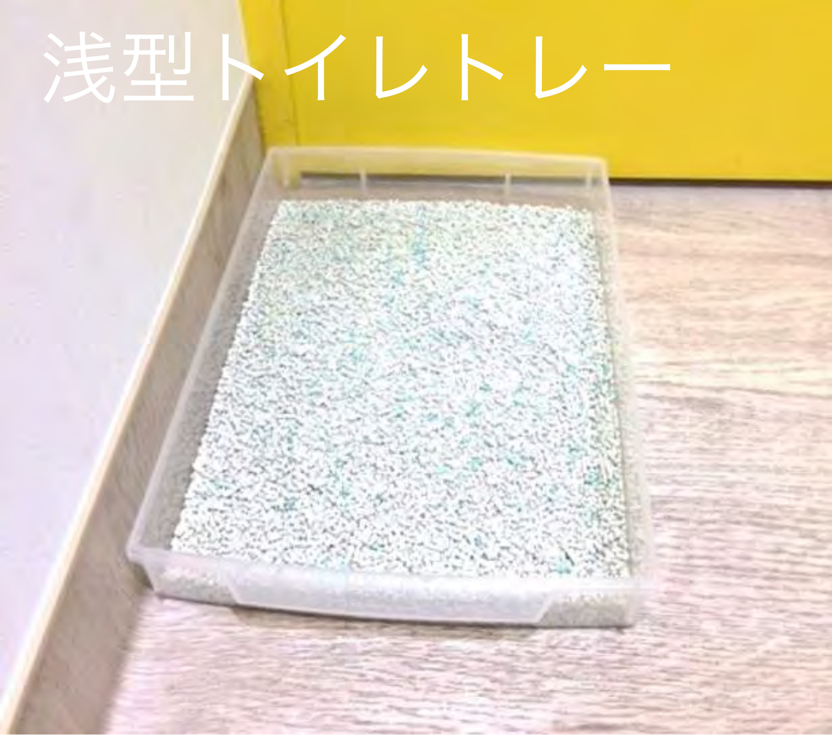
浅型トイレトレー