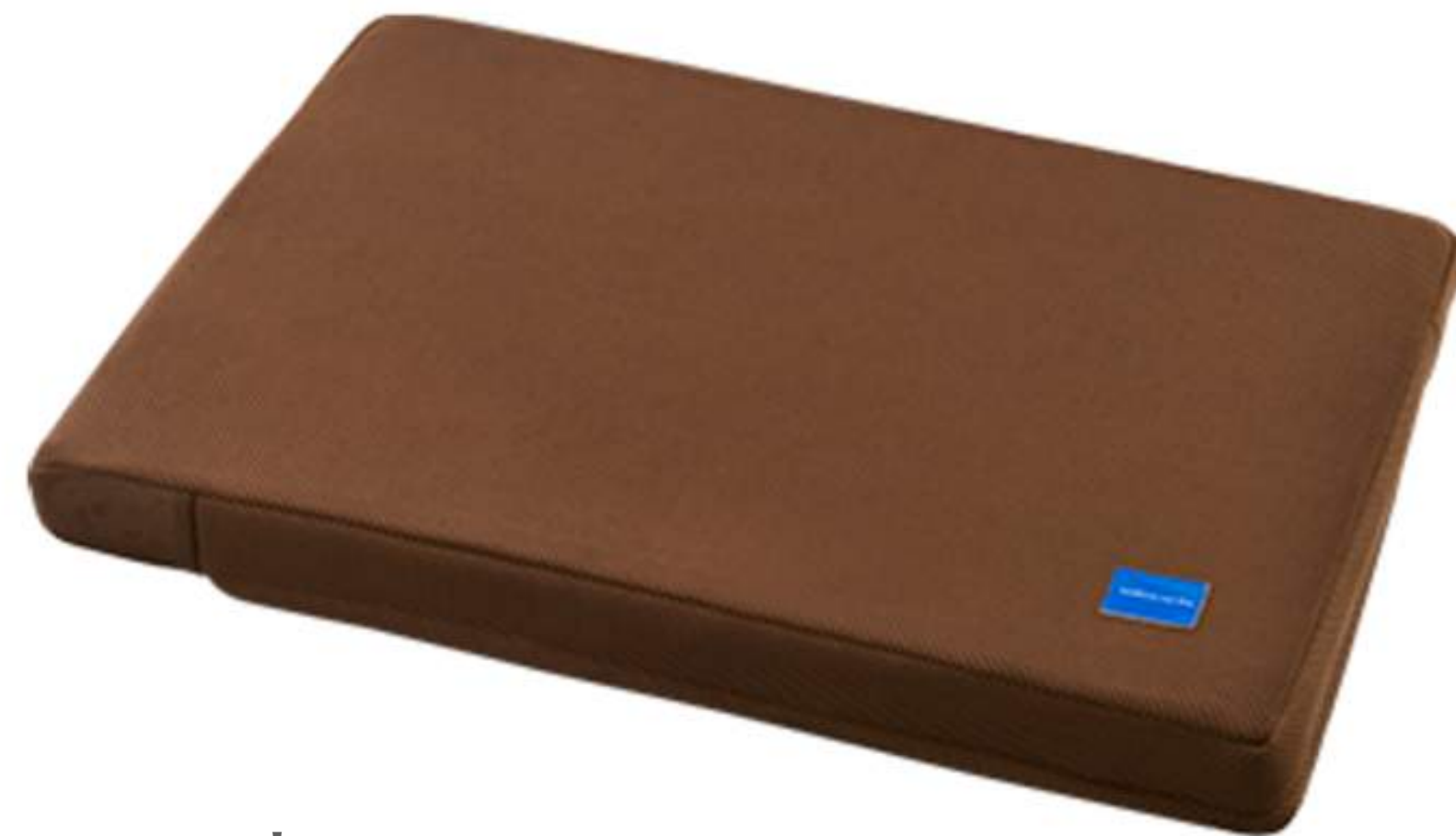
高反発マットレス