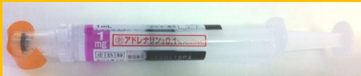
アドレナリン注 0.1%シリンジ

筋肉内注射後15分たっても改善しない場合、また途中で悪化する場合は追加投与を考慮する。