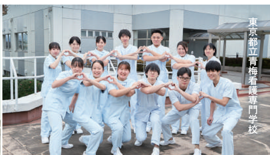
東京都立青梅看護専門学校