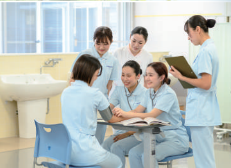
東京都立北多摩看護専門学校