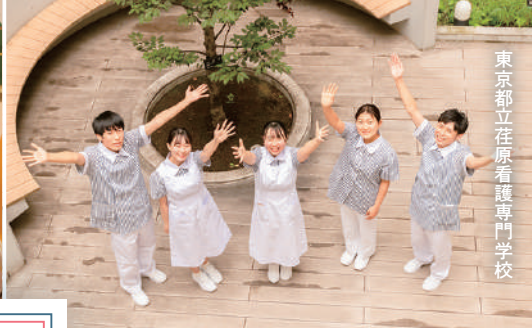
東京都立在原看護専門学校