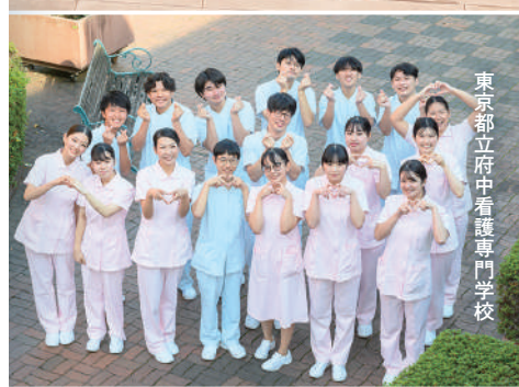
東京都立府中看護専門学校