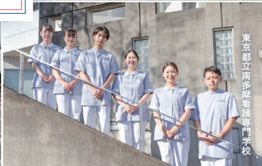
東京都立南多摩看護専門学校