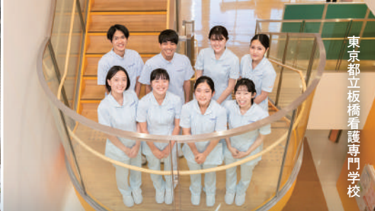
東京都立板橋看護専門学校