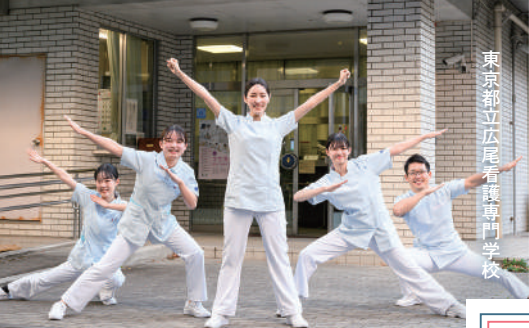
東京都立広尾看護専門学校