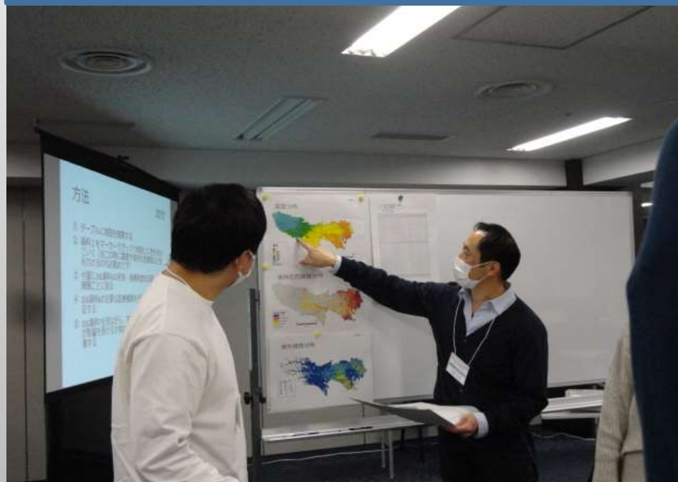
ファシリテーターの災害医療コーディネーターと連携