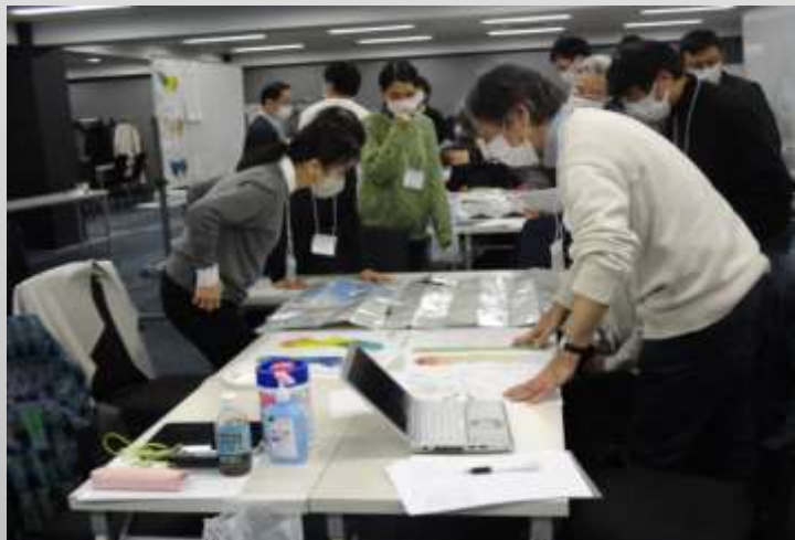
都災害想定に基づき被災状況を分析