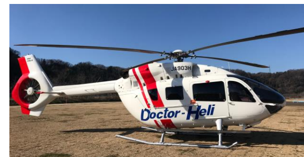
使用機体：エアバス式H145（定員：7人）等

救急医療に必要な機器及び医薬品を装備したヘリコプターであって、救急医療の専門医及び看護師等が同乗し、救急現場等に向かい、現場等から医療機関に搬送できる専用のヘリコプター