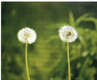
「病者が病者でいられる社会」1990年5月 万博日本庭園