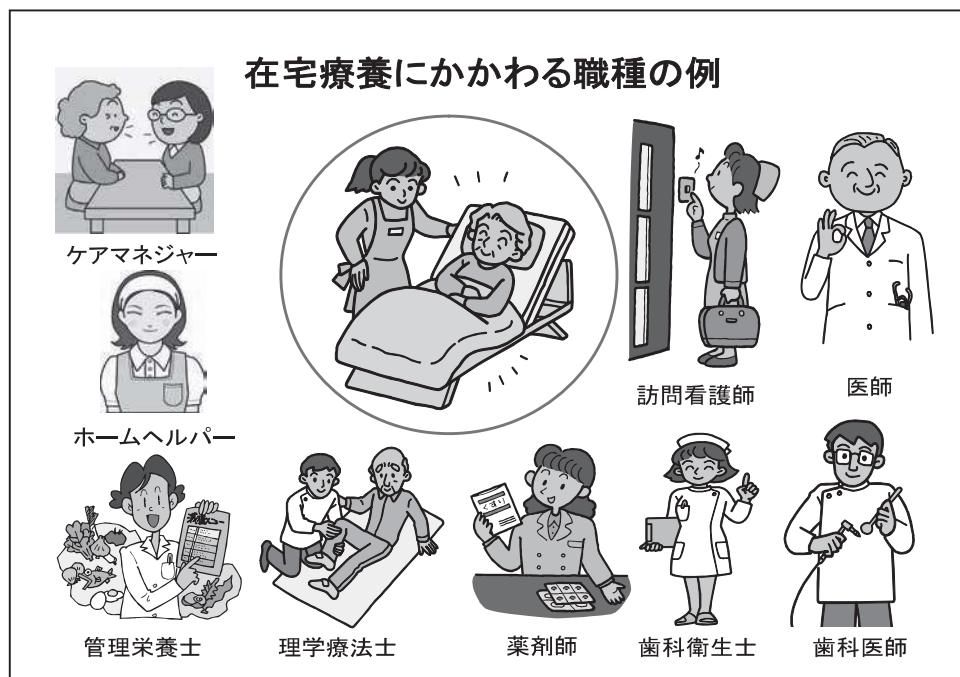
(図4) 在宅療養にかかわる職種の例

在宅療養にはさまざまな職種がかかわることが多い。それぞれの職種の役割を理解し、医療や介護の情報や在宅療養への価値観を共有することが大切である。退院時ケアカンファレンスや在宅ケアカンファレンスを通じて、対象となる在宅療養者にかかわる具体的な職種やケアプランの把握をし、口腔領域の医療や介護の情報を提供することが必要である。