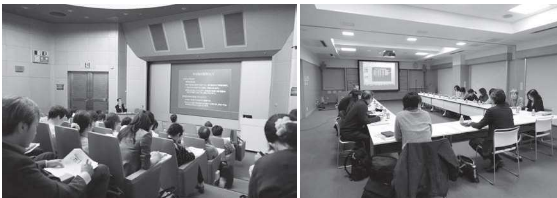
(図2) 多職種連携の会『ちょうふ在宅ケアの輪』の勉強会の様子

地域医療連携は、歯科訪問診療体制の要であることから、地区歯科医師会の研修会、勉強会などを利用して高次医療機関や在宅医、訪問看護師などと「顔の見える連携」「気心の知れた連携」を図りたい。歯科関係者がケアカンファレンスへ参画しやすい環境を整えることも多職種協働の足がかりとなると考える。