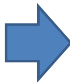
新たな(第六次改定) 施策目標(案)