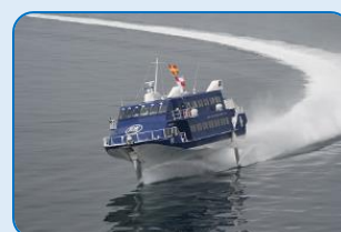
セブンアイランド結