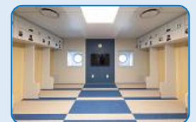
さるびあ丸 2等客室