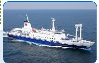
大型客船 さるびあ丸 ⇒

2020年6月に就航した3代目「さるびあ丸」の客室は、フロアタイプのほかにベッドを備えた個室もあり、船内にはレストランやエレベーターを完備しており、バリアフリーにも対応しています。夜行で東京を出発し、デッキからは東京湾や横浜の美しい夜景を望むことができます。高速ジェット船は、時速80kmの高速ながら、波の影響を受けにくい構造で揺れが少なく、快適な船旅が体験できます。