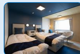
さるびあ丸 特等室