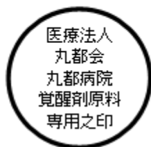
覚醒剤原料 専用印の例